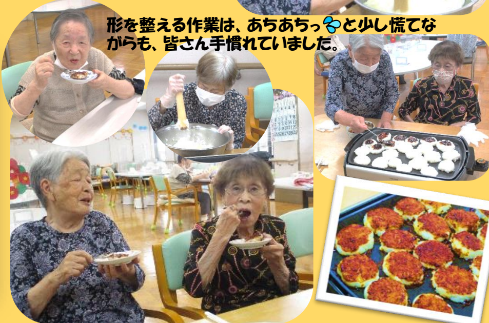
味噌のこんがり焼けた匂いが食欲をそそきます！