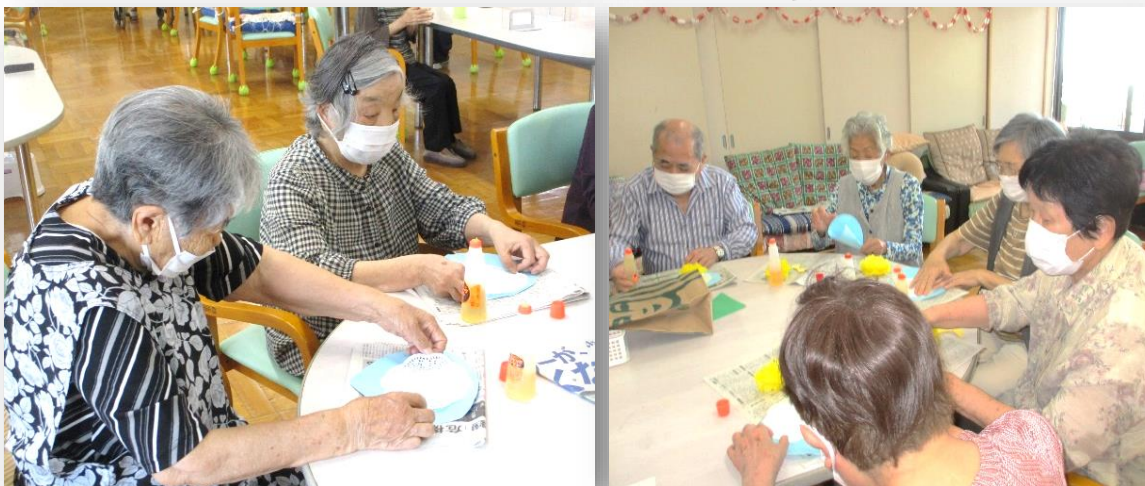
旦那様やご家族様にあげようかしら？と女性の方々も制作に参加されています。