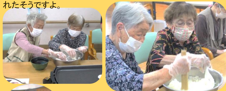
形を整える作業は、あちあちっ と 少し慌てながらも、皆さん手慣れていました。