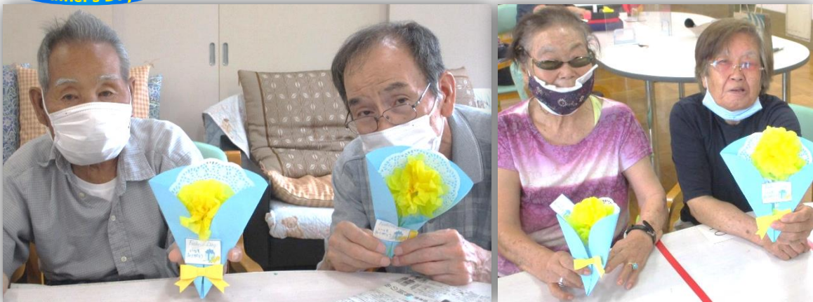
パーツを組み合わせて、カードを制作しました。自分だけの特別な作品になりましたね☆

午後のおやつに、岐阜県や静岡県など山間部の郷土料理である五平餅を作りました。五平餅の名前の由来はその形が神様の供え物である「御幣」に似ていることから名付けられたそうですよ。