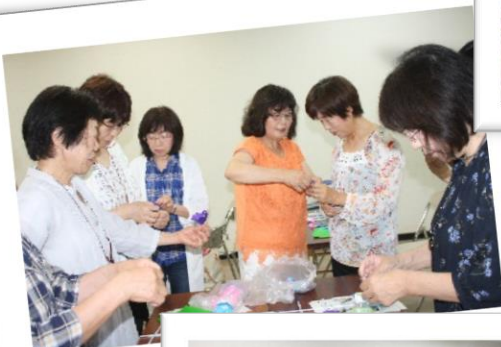
7月 まかせて会員養成講座