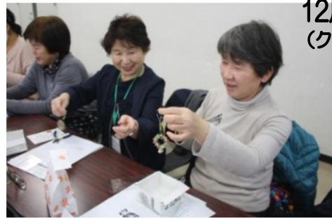
12月 まかせて会員交流会 (クリスマスキーホルダー作り)