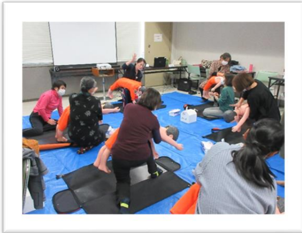
「緊急救命講習」赤十字幼児安全指導員